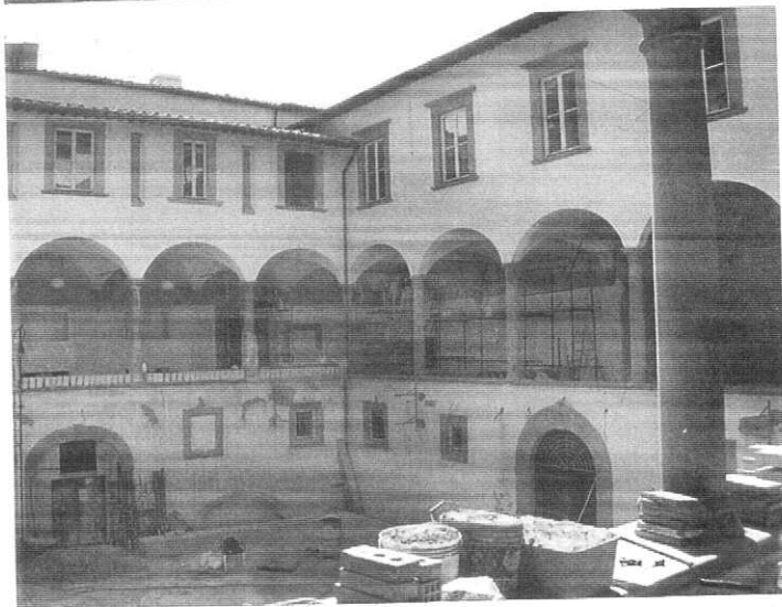
Arezzo, Chiostro dell'ex convento di S. Pier Piccolo, oggi Teatro della Bicchieraia: scoperta e restauro conservativo degli affreschi del sec. X-XII. Sopra, Salone delle Feste del Palazzo delle Statue, sede della Soprintendenza di Arezzo: restauro delle decorazioni e pitture murali a tempera di calce risalenti al 1798. A destra, facciata della Palazzina dell'Orologio ad Arezzo: restauro dei graffiti, decorazioni liberty, elementi a finta pietra.