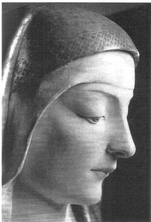
Giovanni Aquilano, scultura in terracotta policroma e dorata, sec. XV, Teramo, Chiesa di San Domenico.

Studio Tre è inoltre impegnato nella ricerca, formulazione e produzione di malte, stucchi, tinteggi e colori storici e tradizionali a base di calce, sabbie silicee, marmi policromi, pigmenti naturali, commercializzati con il marchio ID'A Intonaci d'Arte. E' fornitore ufficiale dei materiali da affresco dell'Institut Europeen des Metiers d'Art di Parigi.